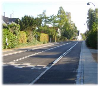
Rudersdalsvej og Dronninggårds Alle

Nu, hvor jeg taler om veje, så vil jeg lige nævne at både Rudersdalsvej og Dronninggårds Alle begge har fået cykelstier i år. Dronninggårds Alle havde indvielse af cykelstierne d. 7. oktober, og selve vejen er blevet flot asfalteret. Vi må konstatere at hastigheden fortsat er den samme, så en fartmåling står på beboernes ønskeliste. Det har jo vist sig, at der på Rudersdalsvej efter en måling ses en sænkning af farten på ca. 3km/t., det da et fremskridt.