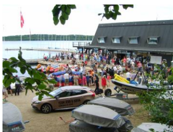
Yachtklubben og havnen

Kommunen vil inden længe sende et brev til beboerne langs Dronninggårds Alle, for at gøre opmærksom på bl.a. det at beplantningerne skal beskæres ind til ejendommens matrikelskel.